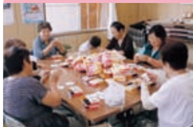
交通安全啓発品の作成