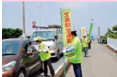
交通安全街頭指導