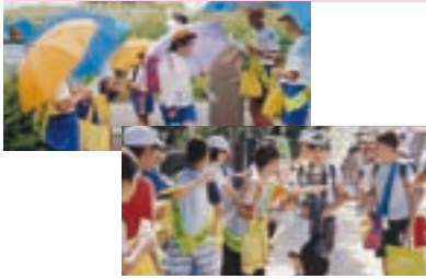
交通少年団の交通安全活動