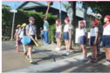
交通少年団の交通安全活動