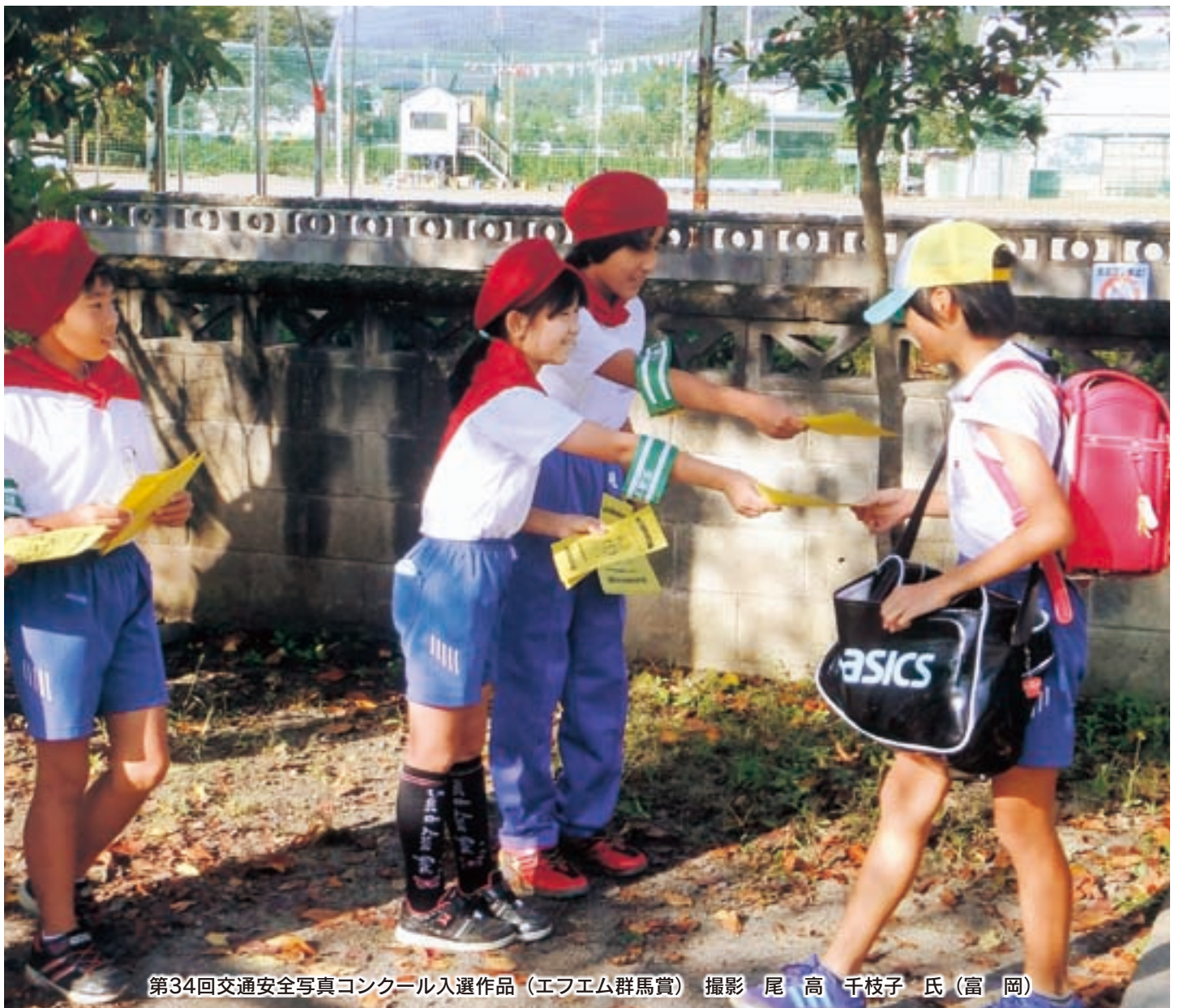
第34回交通安全写真コンクール入選作品 (エフエム群馬賞)