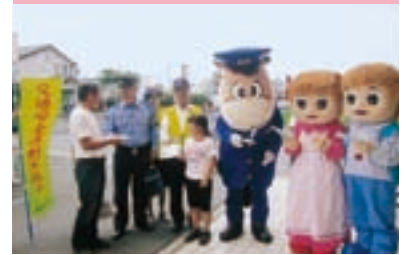
交通安全街頭指導