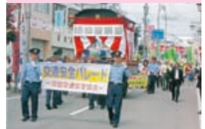
交通安全パレードの実施

交通安全協会では、皆様の会費によって様々な交通安全活動を行っています。交通安全協会へのご入会をお願いいたします。