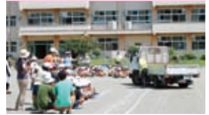
前橋市立総社小学校 交通安全教室