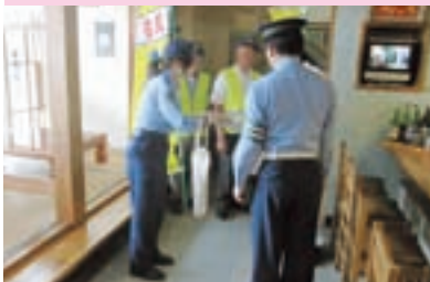
飲酒運転根絶キャンペーン