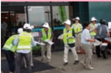
ショッピング作戦の実施