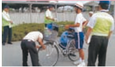
前橋市立第七中学校 自転車マナーアップ運動