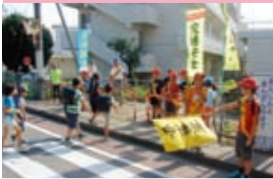
小学生の交通事故防止活動