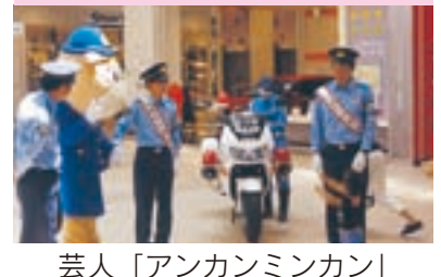
芸人「アンカンミンカン」 一日警察署長