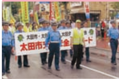
交通安全パレードの実施