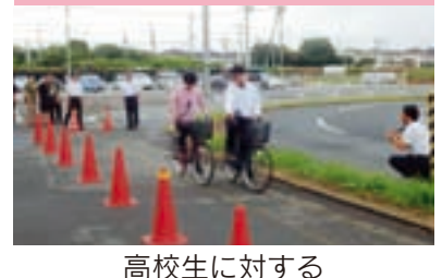
高校生に対する 自転車安全教室の実施