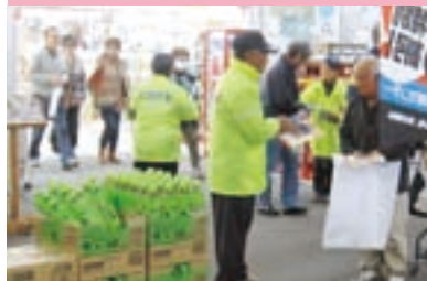
交通安全ショッピング作戦