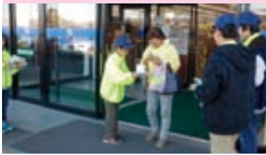
交通少年団の 交通安全ショッピング作戦