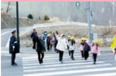
登校時の交通安全指導