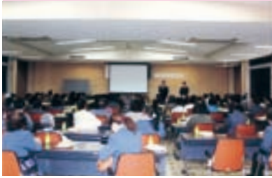
女性部長等研修会