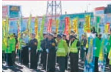
一斉交通安全街頭指導