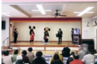
高齢者交通安全教室