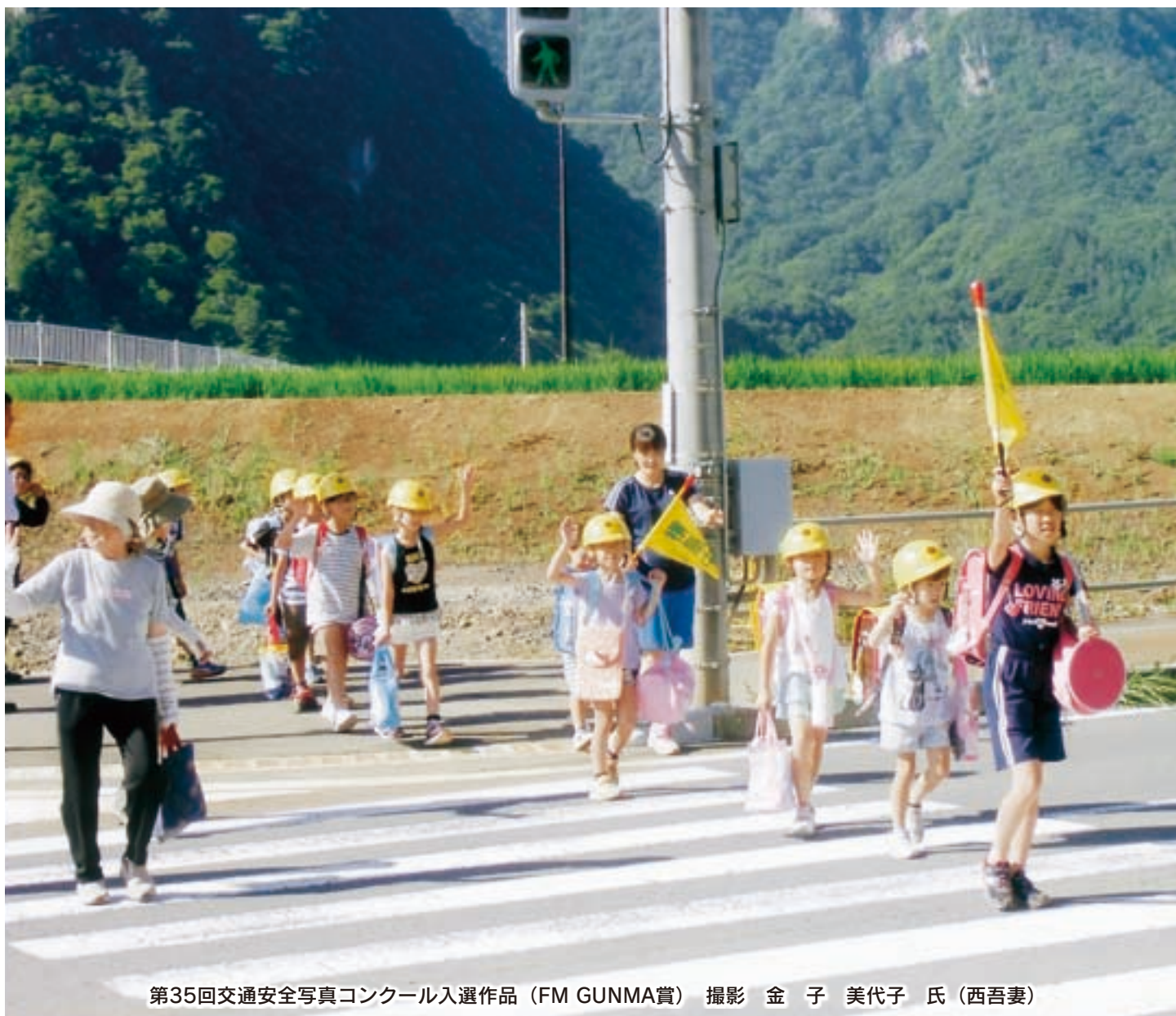
第35回交通安全写真コンクール入選作品 (FM GUNMA賞) 撮影 金子美代子氏 (西吾妻)