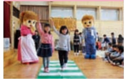
親子の交通安全教室