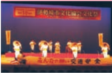
「交通安全八木節音頭」披露