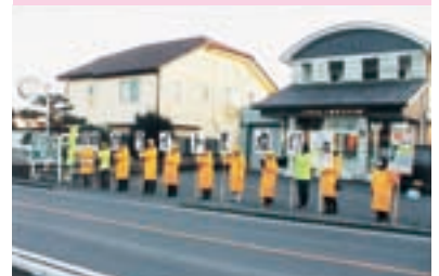
プラカードによる街頭指導