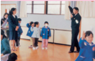
幼稚園交通安全教室