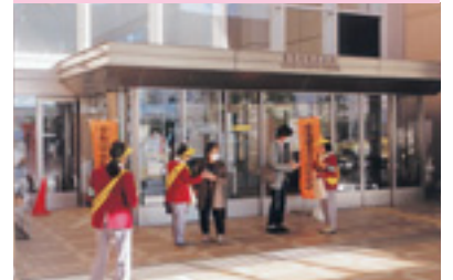
反射材の配布啓発活動