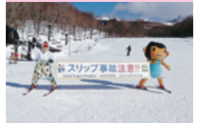
スリップ事故防止啓発活動

交通安全協会では、皆様の会費によって様々な交通安全活動を行っています。交通安全協会へのご入会をお願いいたします。