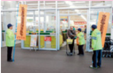
交通安全ショッピング作戦