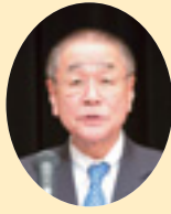
織田沢県議会議長