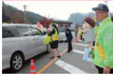
交通安全街頭指導