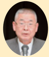
町田県安協理事長

知事からは、交通死亡事故抑止に功勞のあつた三市の交通対策協議会に対する表彰をはじめ、学童・園児の保護誘導に携わるなど、永年、地域