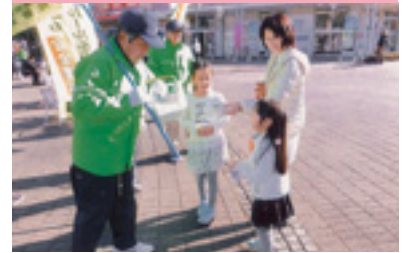
交通安全啓発活動