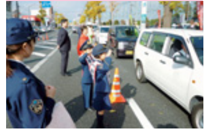
交通安全街頭指導