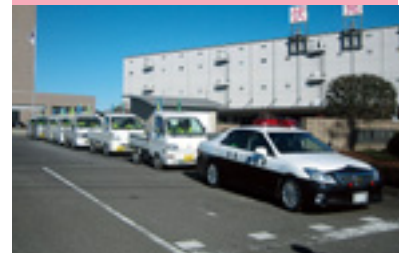
交通安全啓発軽トラパレード