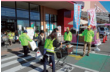
ショッピングママ作戦