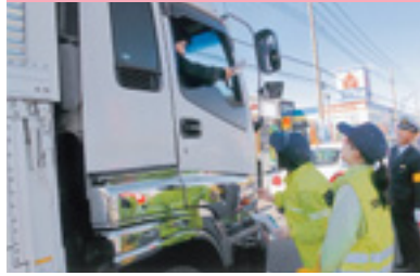
交通安全街頭指導