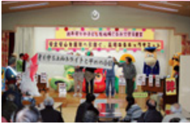
高齢者交通安全教室