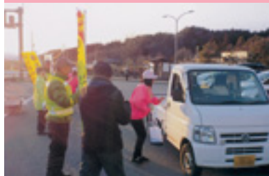
飲酒運転防止啓発活動