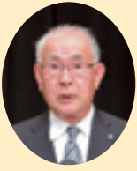
群馬県町村会長 (茂原甘楽町長)