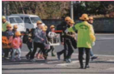
登校児童交通安全街頭指導