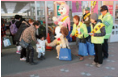
ショッピングママ作戦