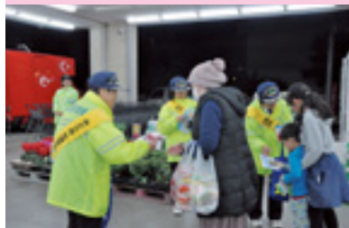
ショッピングママ作戦