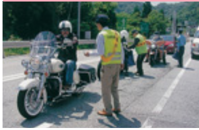
交通事故現場付近街頭指導