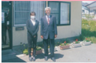
花植プランターの寄贈