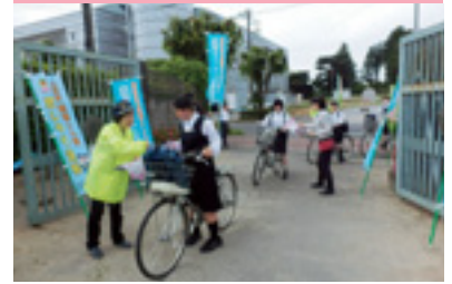
自転車マナーアップ指導