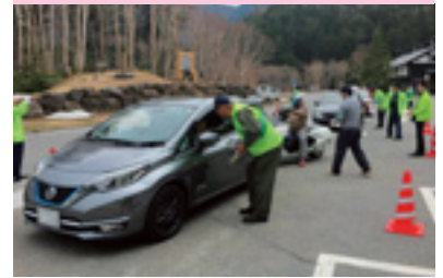
交通安全街頭指導

交通安全協会では、皆様の会費によって様々な交通安全活動を行っています。交通安全協会へのご入会をお願いいたします。