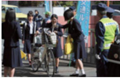
自転車マナーアップ運動