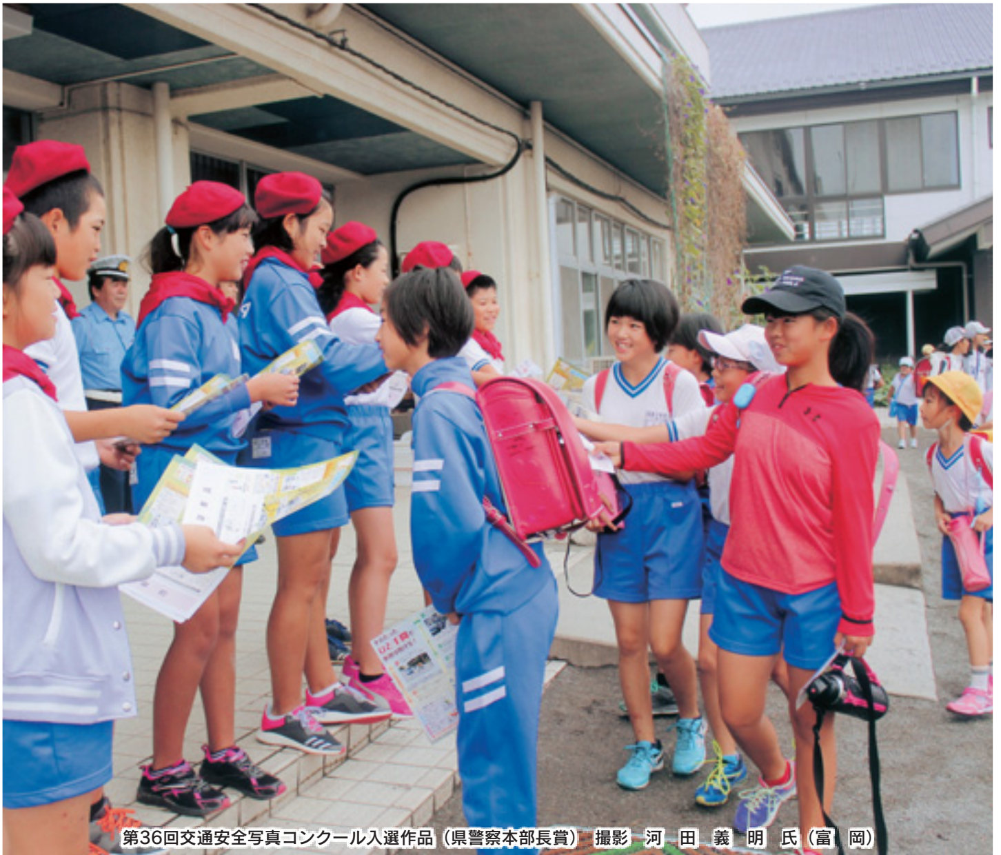
第36回交通安全写真コンクール入選作品 (県警察本部長賞)