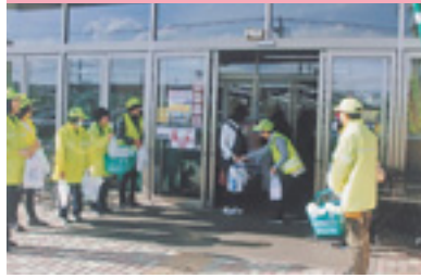
ショッピングママ作戦