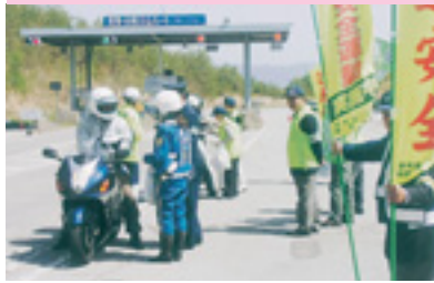
二輪車セーフティーアドバイス