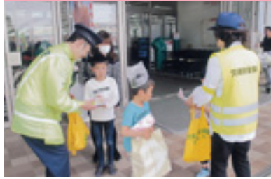
ショッピングママ作戦