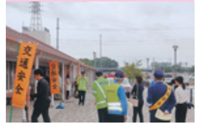
交通安全啓発活動