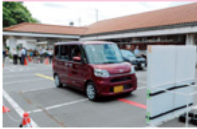
高齢運転者ミーティング