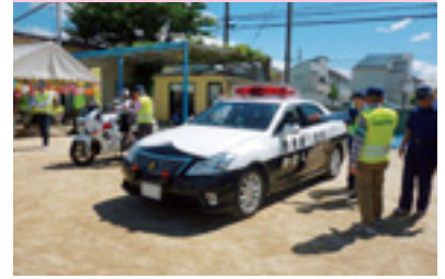
のびゆく子供の集い