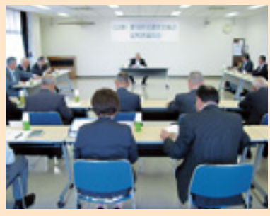
定時評議員会開催風景