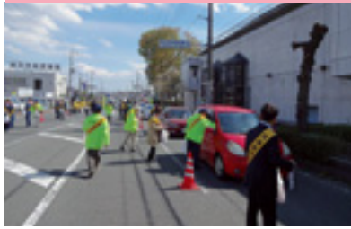
交通安全街頭指導