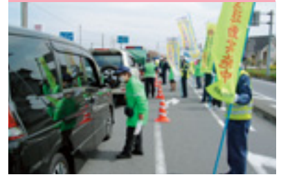
群馬・埼玉合同街頭指導