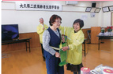
高齢者交通事故防止活動