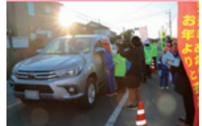
交通少年団交通安全街頭指導