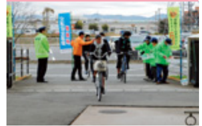
自転車マナーアップ指導