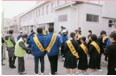
自転車マナーアップ指導