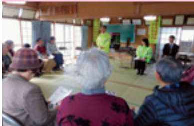
高齢者交通安全教室