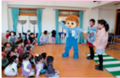
幼児交通安全教室