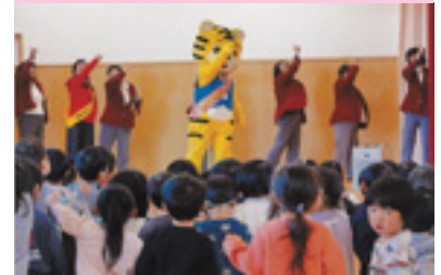
女性部講師団交通安全教室