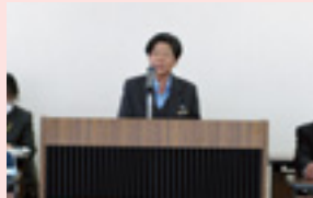
塚田女性部長挨拶