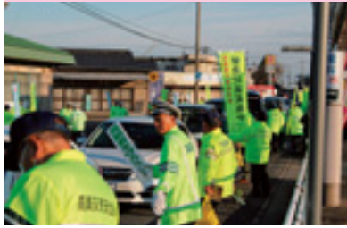
事故現場緊急対策街頭指導