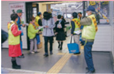
JR駅交通安全街頭指導