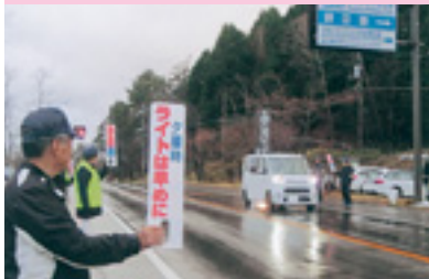
夕暮れ時ライト点灯運動