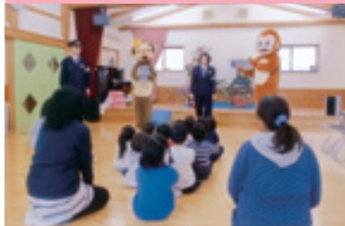
こども園交通安全教室