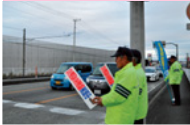
交通安全街頭指導