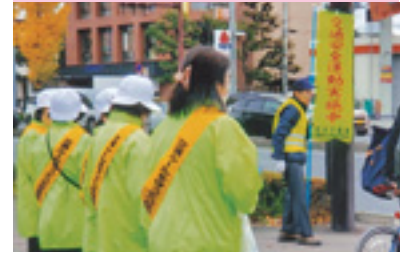
交通安全運動街頭指導