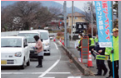
交通安全街頭指導