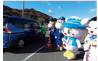
セーフティドライバー作戦

交通安全協会では、皆様の会費によって様々な交通安全活動を行っています。交通安全協会へのご入会をお願いいたします。