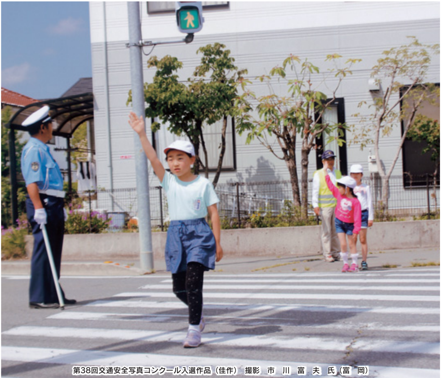
第38回交通安全写真コンクール入選作品(佳作)