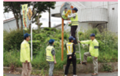
支部員カーブミラー清掃