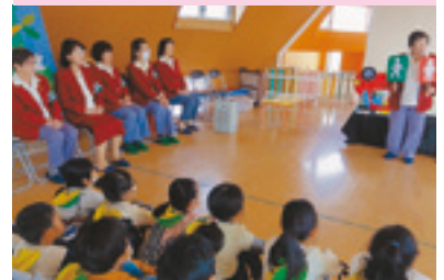
保育園女性部交通安全教室