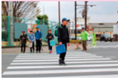
交通安全保護誘導活動