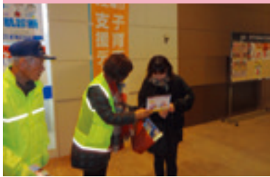
ショッピング作戦