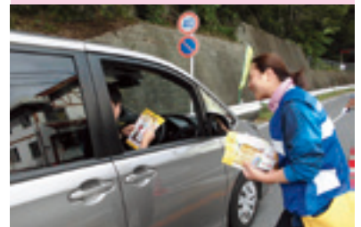
交通安全街頭指導

交通安全協会では、皆様の会費によって様々な交通安全活動を行っています。交通安全協会へのご入会をお願いいたします。