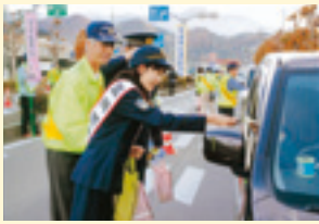
前回の「群馬県知事賞」作品