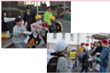
交通少年団交通安全指導