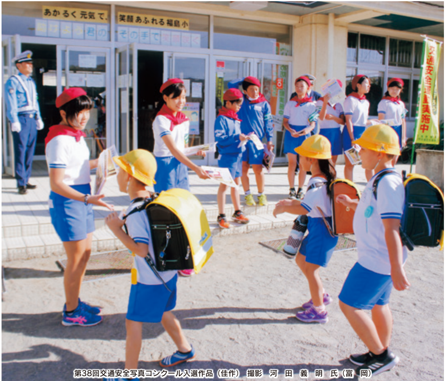
第38回交通安全写真コンクール入選作品(佳作)