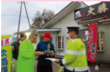
飲酒運転根絶キャンペーン