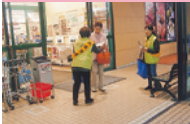
交通安全街頭指導