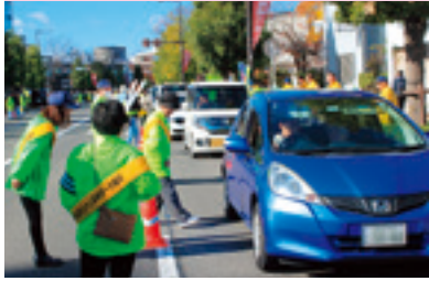
関係団体合同街頭指導