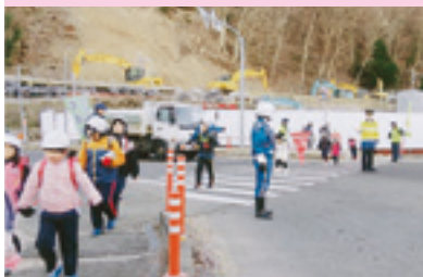
交通安全街頭指導