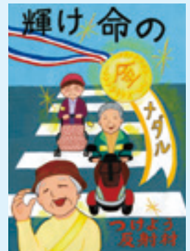
前回の「群馬県知事賞」作品