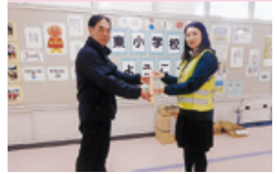
新入学児童交通安全傘贈呈