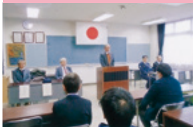
交通安全運動出動式