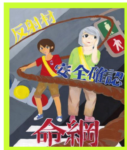
エフエム群馬賞 菊池 美里さんの作品