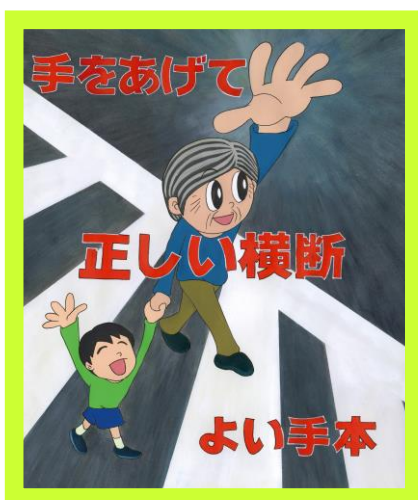
群馬テレビ賞 遠間 厚子さんの作品