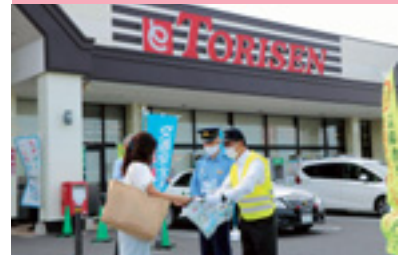
交通安全街頭啓発