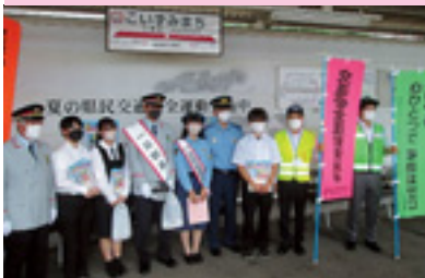
一日警察署長・駅長街頭指導