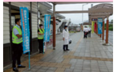
自転車マナーアップ指導

交通安全協会では、皆様の会費によって様々な交通安全活動を行っています。交通安全協会へのご入会をお願いいたします。