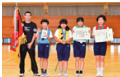
団体優勝 館林市立美園小学校チーム

大会には、県内一〇地区の代表一〇校（一チーム四名・三名）三七人の児童が出場し、交通ルールを中心とした学科（交通規則・道路標識等）と実技（安全走行・技能走行）競技を行いました。