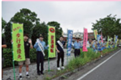
一日警察署長街頭指導