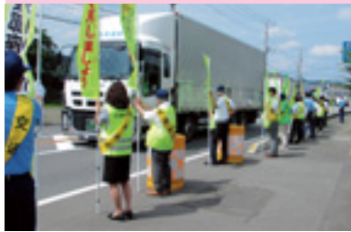
夏の県民交通安全運動街頭指導