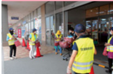
夏の県民交通安全運動街頭指導