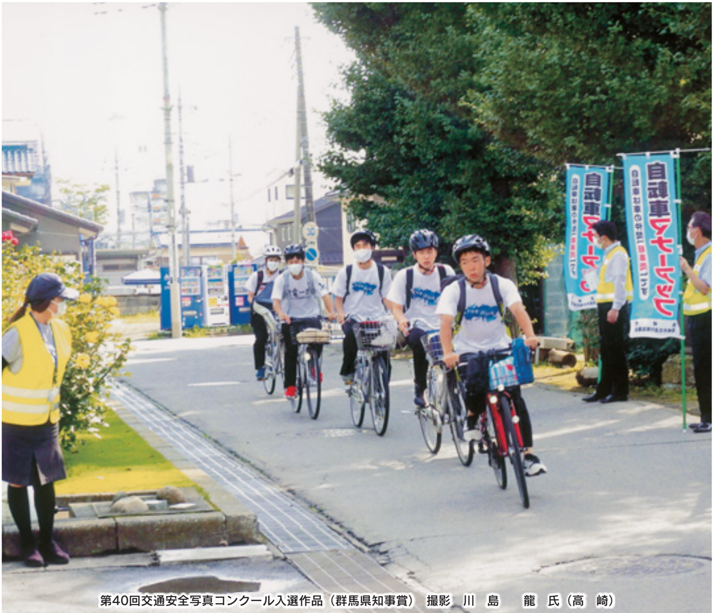
第40回交通安全写真コンクール入選作品（群馬県知事賞）