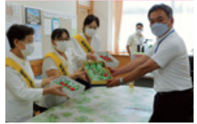
交通安全グッズ（無事カエル）贈呈