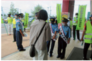
夏の県民交通安全運動開始式