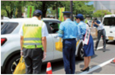
夏の県民交通安全運動街頭指導