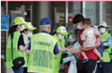
交通安全ショッピング作戦