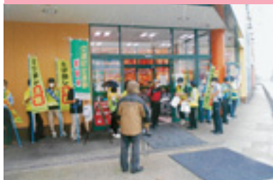
シートベルト着用啓発