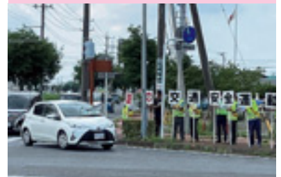
夏の県民交通安全運動街頭指導