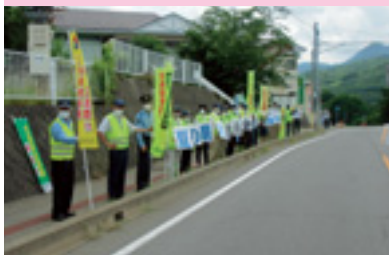
西吾妻セフティアドバイス