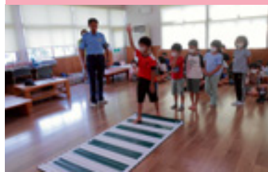
保育施設交通安全教室