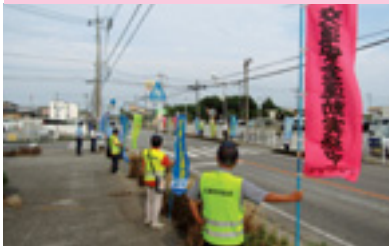
交通安全街頭啓発