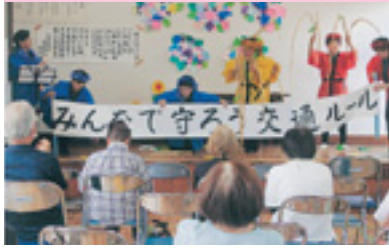
高齢者交通安全教室