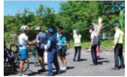
赤城山交通安全啓発