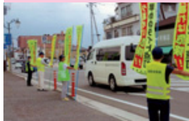
早めのライト点灯啓発