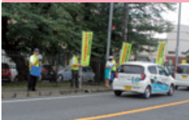
交通安全街頭指導