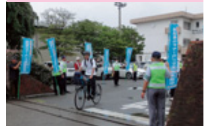
自転車マナーアップ指導