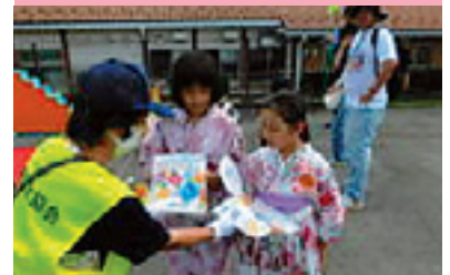
イベント会場交通安全啓発