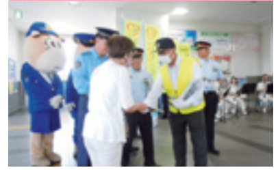
踏切事故「0、ゼロ」キャンペーン