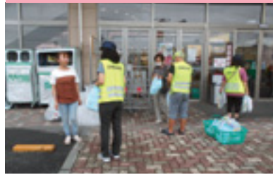
ショッピングママ作戦