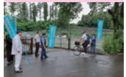
自転車マナーアップ指導

交通安全協会では、皆様の会費によって様々な交通安全活動を行っています。交通安全協会へのご入会をお願いいたします。