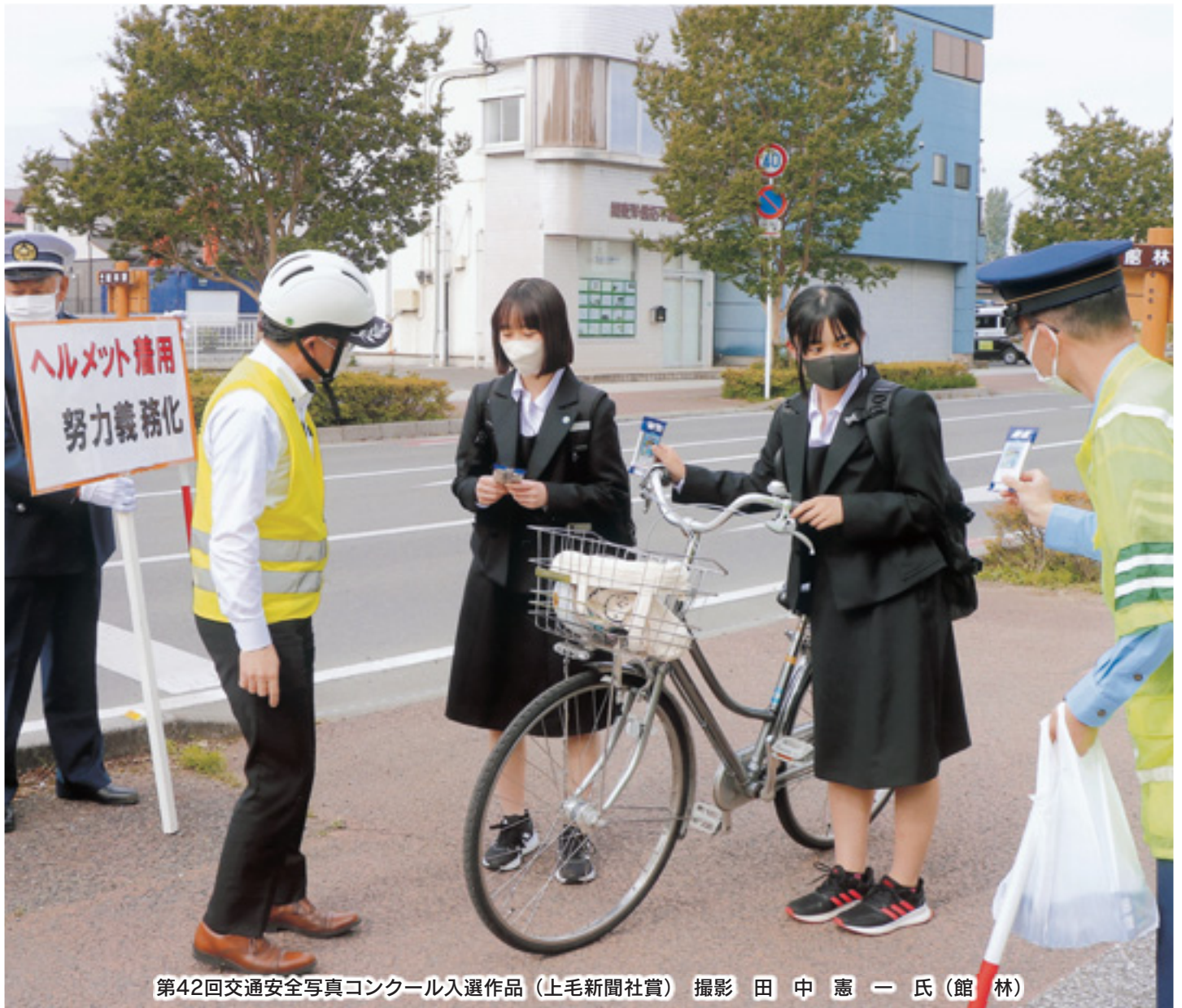
第42回交通安全写真コンクール入選作品 (上毛新聞社賞) 撮影 田中憲一氏 (館林)