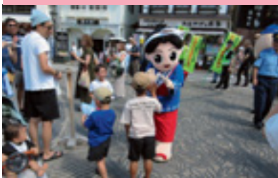
草津「湯畑」交通安全街頭指導