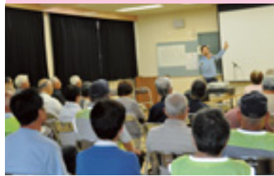
高齢者交通安全教室