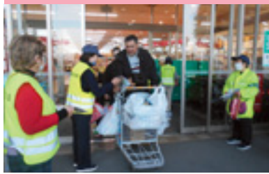
ショッピングママ啓発