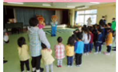
園児交通安全教室