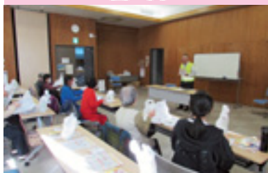
高齢者交通安全教室