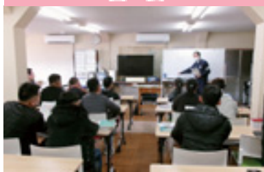
技能実習生交通ルール指導