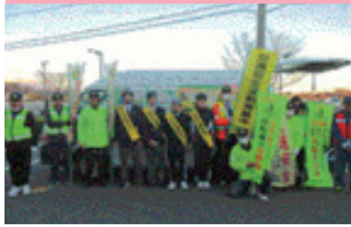
自転車マナーアップ運動