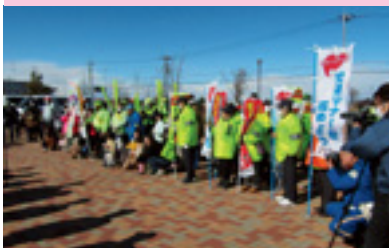
合同交通安全キャンペーン