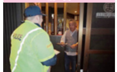
飲酒運転根絶啓発

交通安全協会では、皆様の会費によって様々な交通安全活動を行っています。交通安全協会へのご入会をお願いいたします。