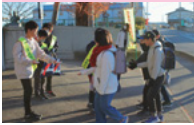
交通安全少年団交通安全指導