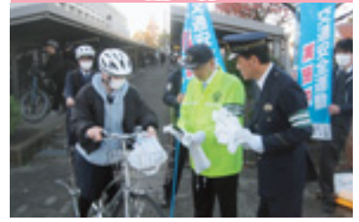
自転車マナーアップ啓発