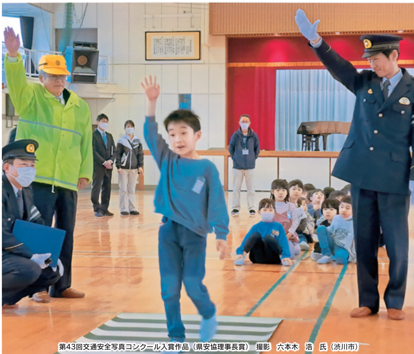
第43回交通安全写真コンクール入賞作品 (県安協理事長賞)