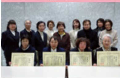
県女性部大会功労表彰